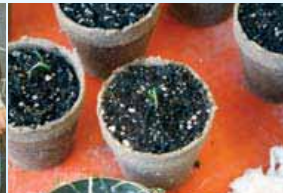
Pouponnière de violettes africaines, École Enfant-Soleil