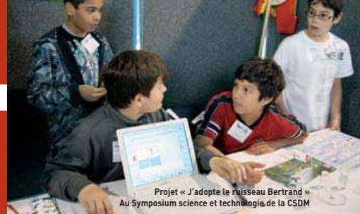
Projet « J'adopte le ruisseau Bertrand » Au Symposium science et technologie de la CSDM

Fiers de leur projet, les élèves ont même eu l'occasion de présenter leurs recherches lors du Symposium science et technologie de la Commission scolaire de Montréal qui se tenait les 23 et 24 avril 2009 au Centre des sciences de Montréal. Nous leur souhaitons bonne chance dans la poursuite de leurs activités.