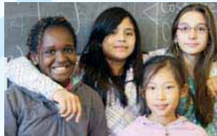
L'équipe Ouverture, École Enfant-Soleil

HÉROS est un mouvement qui part de l'individu et se tourne vers le genre humain. Il s'appuie sur cinq valeurs clés (humanité, écocitoyenneté, respect, ouverture et solidarité), qui sont au cœur d'une société harmonieuse et d'un environnement sain. HÉROS vise à renverser les tendances actuelles : contribuer à réduire la marque (empreinte) écologique pour favoriser la marque sociale, c'est-à-dire passer des impacts négatifs du développement aux impacts positifs, socialement acceptables et durables. Dans sa structure et sa philosophie, HÉROS cherche à tisser une toile solidaire, flexible, mais solide comme base de la société de demain, en misant sur l'individu et en cherchant à rendre chaque maille de cette toile responsable et solidaire de l'ensemble.