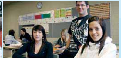
Un cours d'Éthique et environnement, École secondaire Rive-Nord